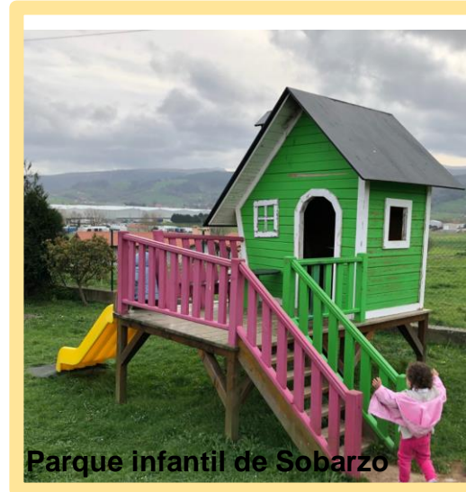
Parque infantil de Sobarzo