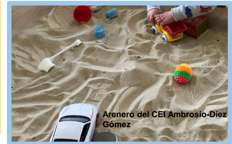
Arenero del CEI Ambrosio-Díez Gómez